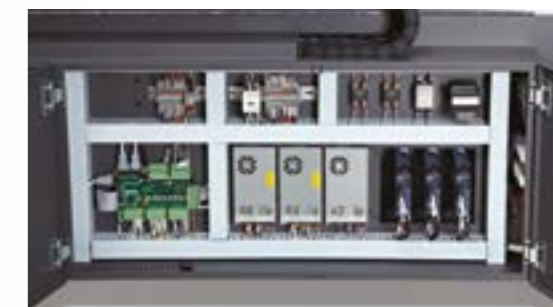
Intégration industrielle des différents composants