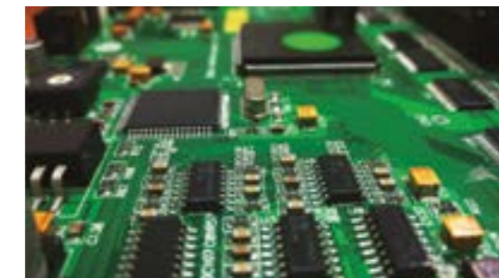
Cartes de circuits imprimés spécifiquement développées